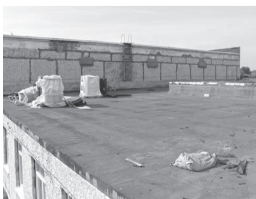
Капитальный ремонт кровли в Нижнеиленской СОШ.