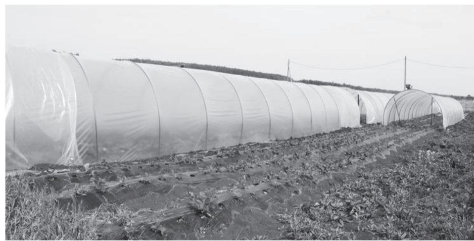
Для получения более раннего урожая Артём построил десять теплиц.