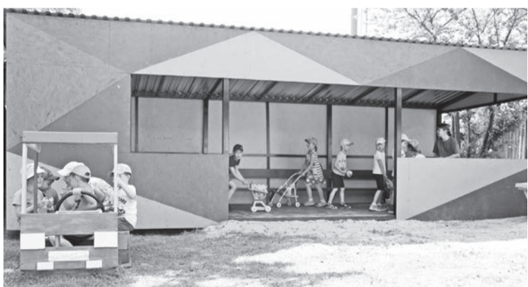
В детском саду «Родничок» для ребят построена новая веранда.