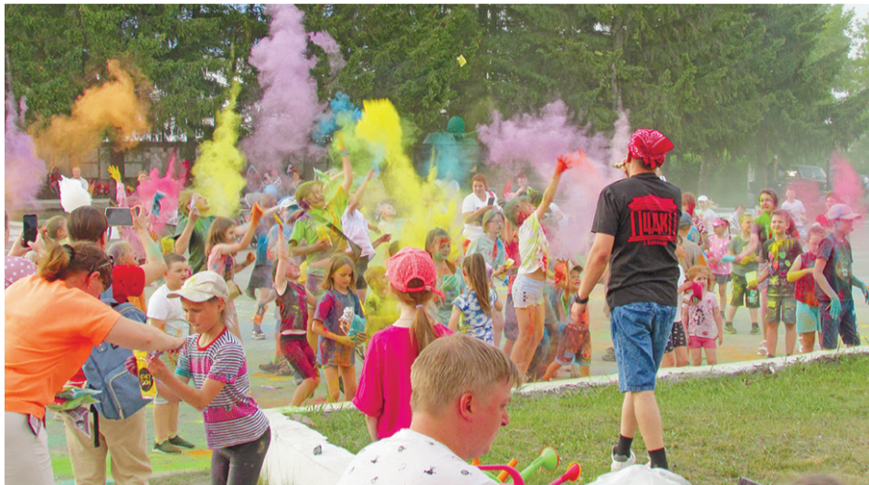
Краски холи принесли много радости.

Сказочные персонажи пригласили всех на просмотр мультфильмов в кинозал «Горизонт». А в фойе ЦДК под руководством преподавателя