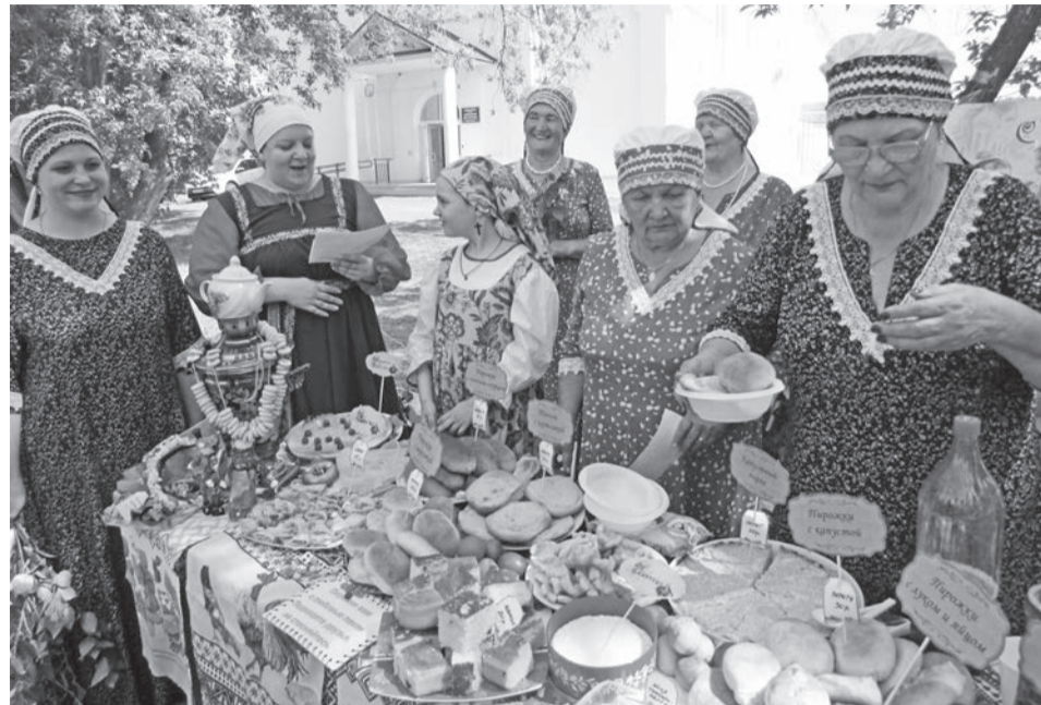
Самый интересный и аппетитный конкурс – на «Лучший торговый ряд».

Испокон веков славили в этот день символ России – русскую белоствольную берёзку, посвящая ей стихи, песни и хороводы. По старой традиции