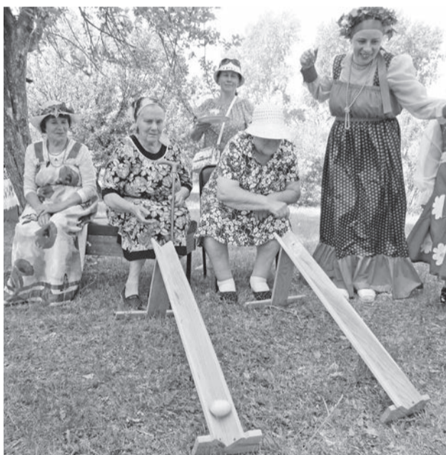
Народные игры привлекли многих участников.