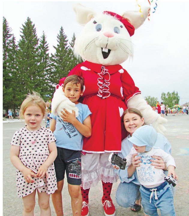
Сказочные персонажи поднимали всем настроение.

Первый день лета прошёл на ура. Пусть все каникулы будут наполнены весельем, добром и задором!