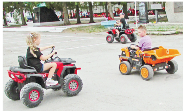
Для детей работали аттракционы.