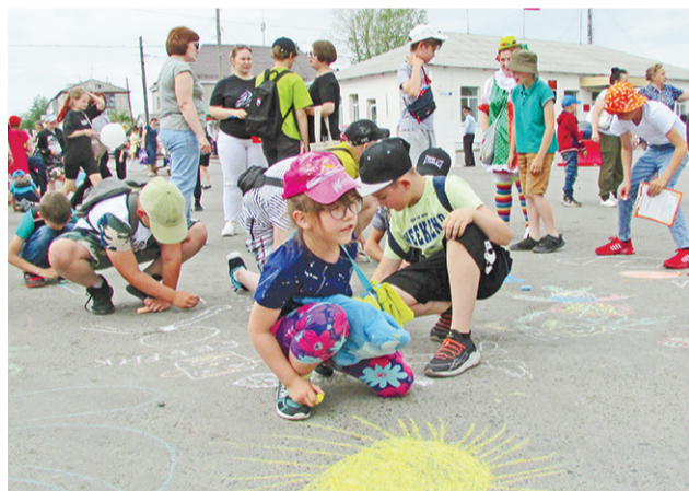
На площади появились разноцветные рисунки.