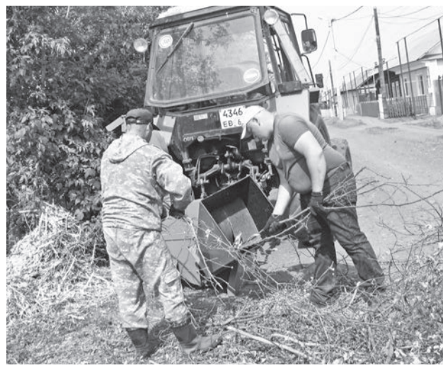
В арсенале службы – измельчитель веток.

Ранее мы сообщали, что в Шадринке началось строительство нового модульного ФАПа.