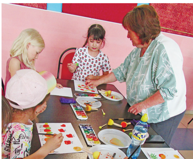
Педагоги ДШИ провели мастер-классы по рисованию.