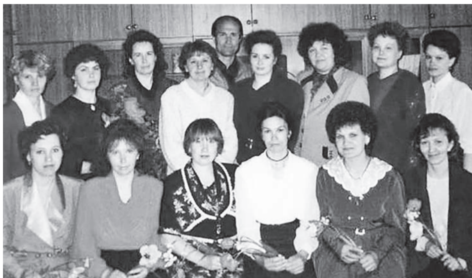
1999 год. Последний звонок.

Быстро пролетели 5 лет. И Еланская школа вновь празднует юбилей. Да какой! 150 лет! Сколько событий произошло за этот период. Что-то забылось, но многое осталось в нашей памяти и стало историей. За этой датой стоят люди, выпускники, которые размахались по всей нашей необъятной стране, и, конечно же, педагоги, проработавшие в школе не один десяток лет.