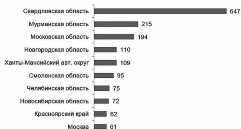
Регионы с наибольшим количеством высоких и экстремально высоких загрязнений пресноводных объектов в 2022 г.

Специалисты отмечают, что чаще всего в водоёмах фиксируется переизбыток соединений марганца, соединений цинка, легкоокисляемых органических веществ, нитритного азота и соединений меди.