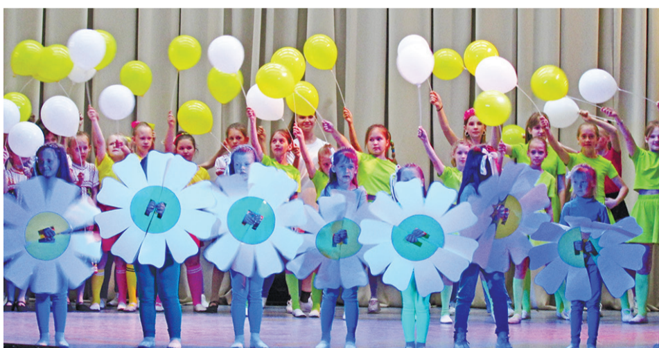
На фестивале «Улыбки лета» блистали артисты из организаций дополнительного образования.

Открыла фестиваль вокальная группа «Бусинки» из детско-юношеского центра «Созвездие» песней «Лето». Хореографически композицию представила Байкаловская спортивная