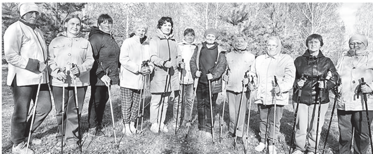
Спорткомитет Байкаловского района организовал мастер-класс для людей старшего поколения.

В связи с празднованием Всемирного дня скандинавской ходьбы Спорткомитет Байкаловского района организовал мастер-классы «Особенности скандинавской ходьбы для людей старшего поколения (55+)» в