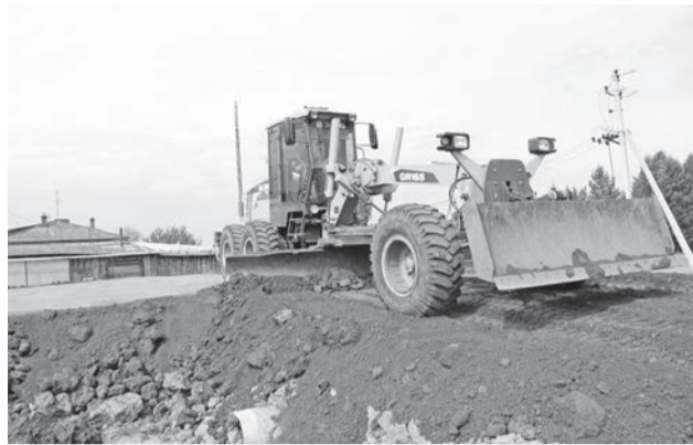
Строительство дороги до Сапегиной продолжается.

Как обычно, после завершения отопительного сезона на территории сельских поселений начинаются ремонтные и строительные работы жилищно-коммунального характера. Это ремонт дорог, прокладка систем водоснабжения, строительство и обустройство нецентрализованных источников водоснабжения.