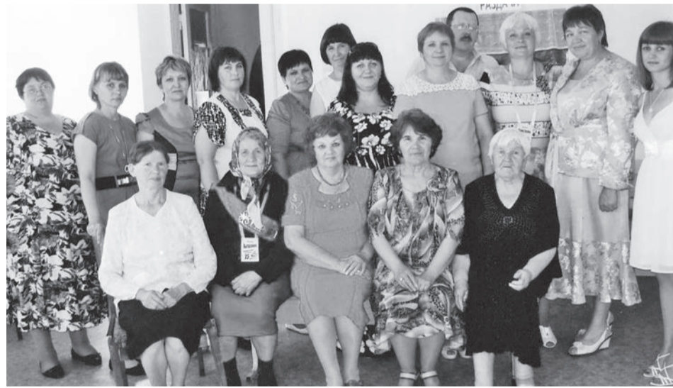
140-летний юбилей Еланской школы.